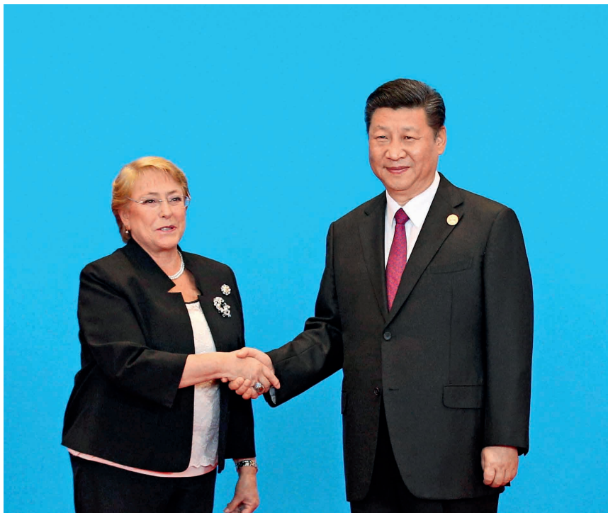
15 de mayo de 2017. El presidente Xi Jinping saluda a su homóloga chilena, Michelle Bachelet.