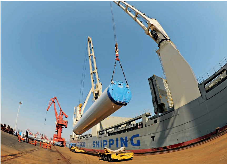
27 de abril de 2017. Equipos de energía eólica en el puerto de Lianyungang, en Jiangsu, son embarcados para su exportación.

Este proyecto va aparejado con la propuesta de construir conjuntamente con los países de la ANSEA, así como con la India, Pakistán y los países del norte de África, la Ruta Marítima de la Seda del Siglo XXI.